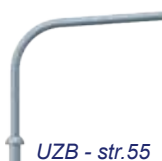
UZH - str.55

Počet ramen výložníku a jejich délka vyložení je stanovena v závislosti na výšce díku stožáru a jeho celkovém zatížení (hmotnost a plocha vlastního výložníku včetně použitých svítidel).